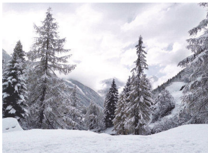
Die Aussichten beim Winterwandern.